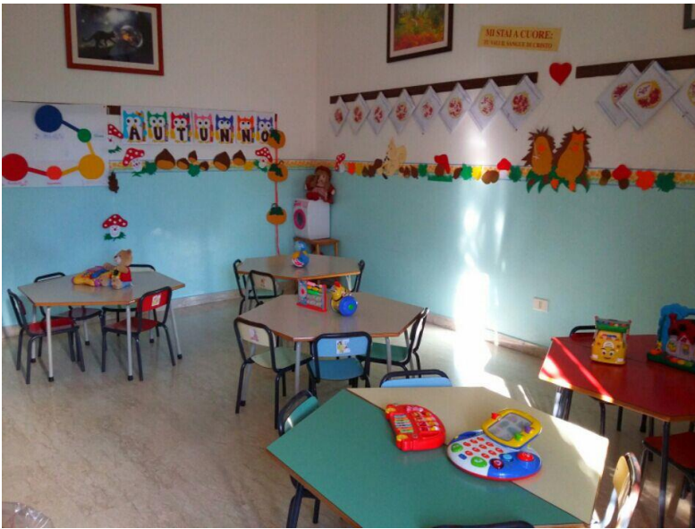
La sezione dei più piccoli...”Primavera”